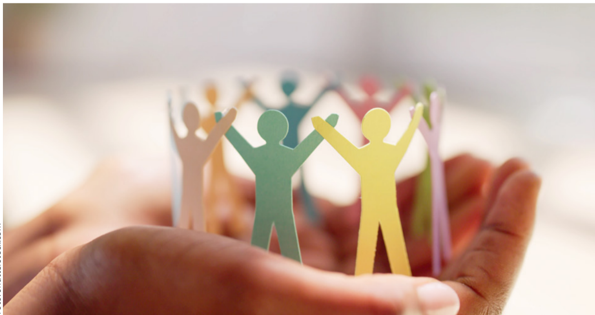
In unserem Erzbistum gibt es viel gelebtes Vertrauen: in Teams, Gemeinden, Einrichtungen, Gremien und Netzwerken

Am Ende werden Strukturen, Konzepte und Finanzpläne wichtig sein. Aber sie tragen nur, wenn Menschen ihnen Leben geben. Dafür braucht es Vertrauen – ineinander und in die Zukunft, die wir gemeinsam gestalten können. ●