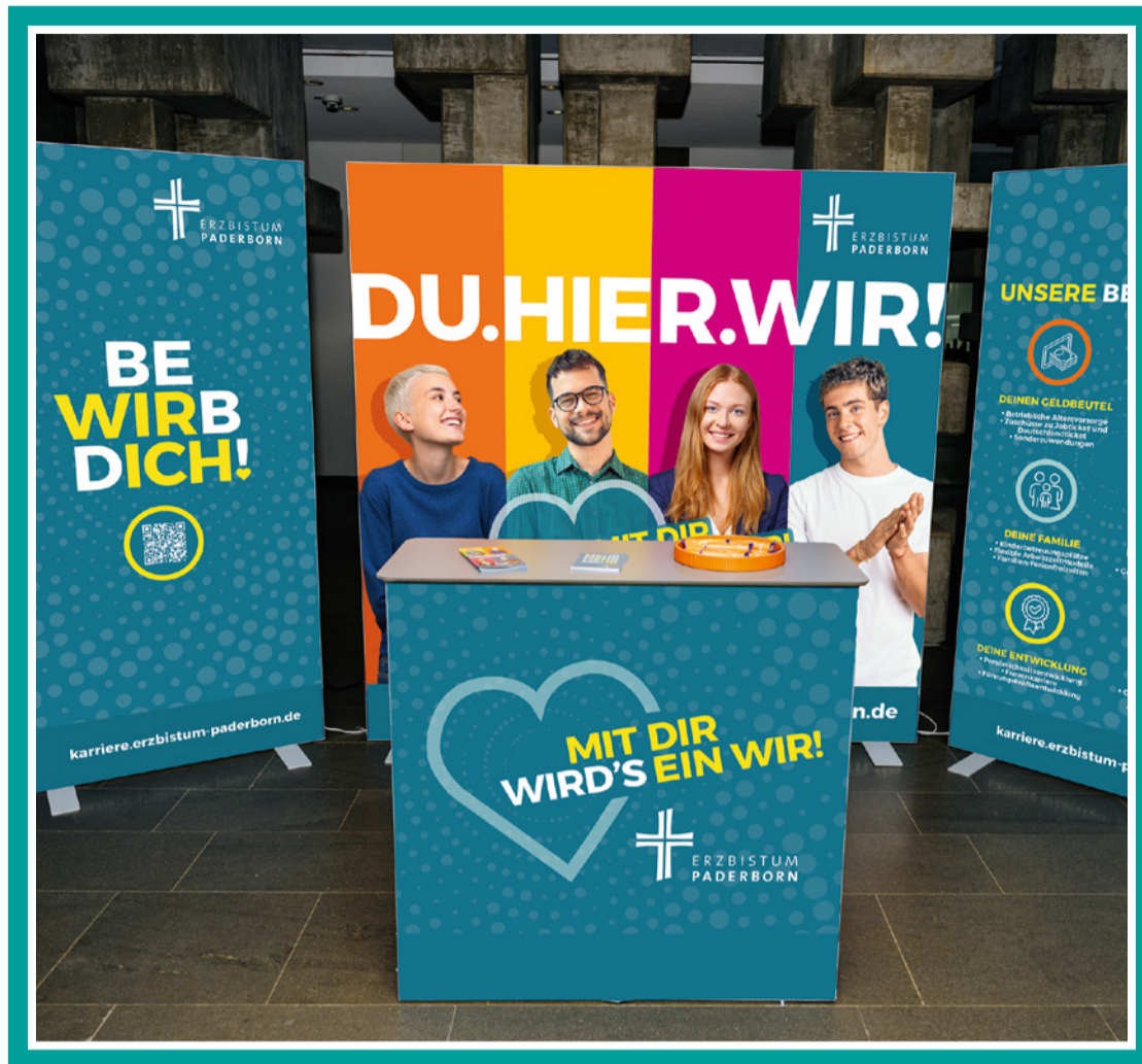
Auch der neue Messestand feierte bei den „NULLSIEBEN Karrieretagen“ Premiere

Ihren ersten öffentlichen Auftritt hatte die Kommunikationslinie des Employer Brandings für Ausbildungsberufe am 29. und 30. Mai 2026 bei den „NULLSIEBEN Karrieretagen“ des SC Paderborn in der Home Deluxe Arena – eine neue Plattform für berufliche Perspektiven, die Wirtschaft, Nachwuchstalente und Zukunftschancen in einer besonderen Atmosphäre zusammenbringen soll. Im September folgt dann die ergänzende Kommunikationslinie für pastorale Berufe auf Karrieremessen wie der „Connect“.