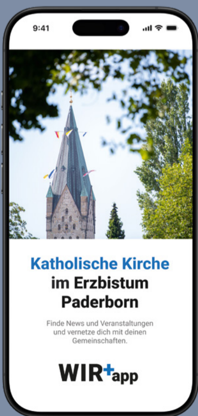
Der Fokus von wir+app liegt auf der Kommunikation und dem Austausch von Inhalten. Es ergänzt den Flexiblen Internetbaukasten FLIB

wir+app wird den 21 Seelsorgeräumen im Erzbistum kostenlos zur Verfügung gestellt.