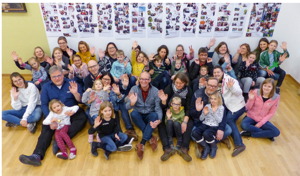
Erstkommunionvorbereitung für Familien in der Landvolkshochschule Hardehausen (LVH)

Zeit mit dem eigenen Kind während der Kommunionvorbereitung verbringen: Was ungewöhnlich klingt, ist seit 2016 in Hardehausen Realität. Über 90 Kinder und 90 Eltern erlebten 2025 diese gemeinsamen Tage in der Landvolkshochschule.