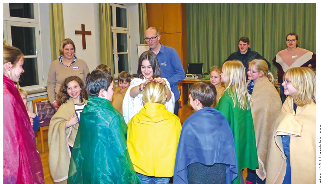
Über 90 Kinder und 90 Eltern erlebten 2025 die gemeinsamen Wochenenden in der Landvolkshochschule