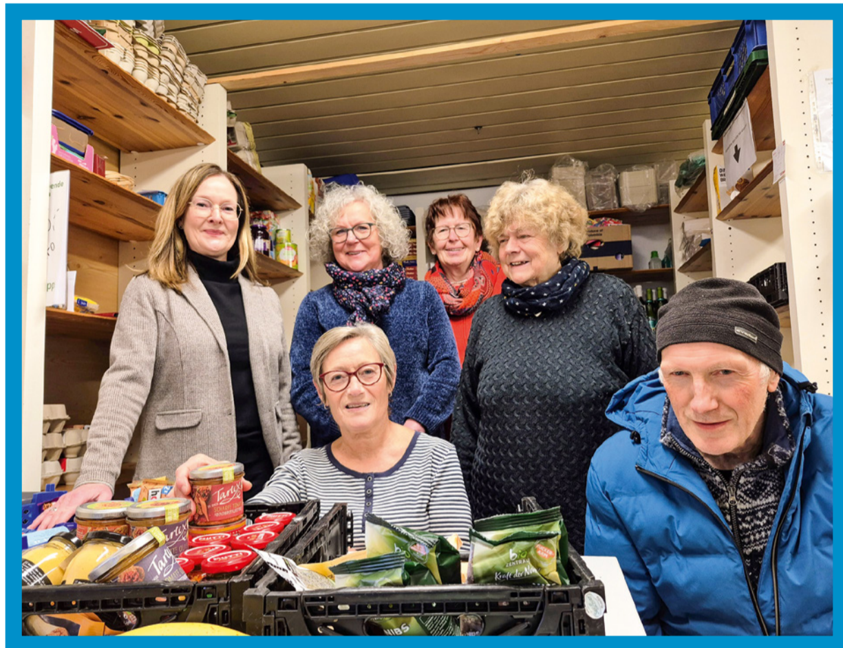
Die „Warenkörbe“ des Caritasverbands Brilon: Rund 1.300 bedürftige Menschen kaufen dort gegen einen Obolus ein

Bei Armut denken viele an unbezahlbaren Wohnraum in Metropolen, an soziale Brennpunkte oder Obdachlose in Einkaufsstrassen. Auf dem Land wird Armut weniger vermutet. Dabei liegt die Armutsgefährdungsquote in NRW in ländlichen Regionen nur etwas unter der städtischen. Auf dem Land ist man also auch arm – nur eben anders. Der Armuts- und Reichtumsbericht der Bundesregierung zeigt: Während Städte stärker von sozialräumlicher Segregation betroffen sind, leidet der ländliche Raum unter Erreichbarkeits-, Mobilitäts- und Angebotsarmut – unter weiten Wegen, schlecht erreichbaren sozialen Diensten, einem schwachen ÖPNV und weniger Arbeitsplätzen für Niedrigqualifizierte. Betroffen sind in NRW vor allem ältere Menschen, die auf dem Land häufiger armutsgefährdet sind als in der Stadt. Dass sich Armut in ländlichen Gebieten weniger konzentriert, sondern verstreut auftritt, hat zwei gravierende