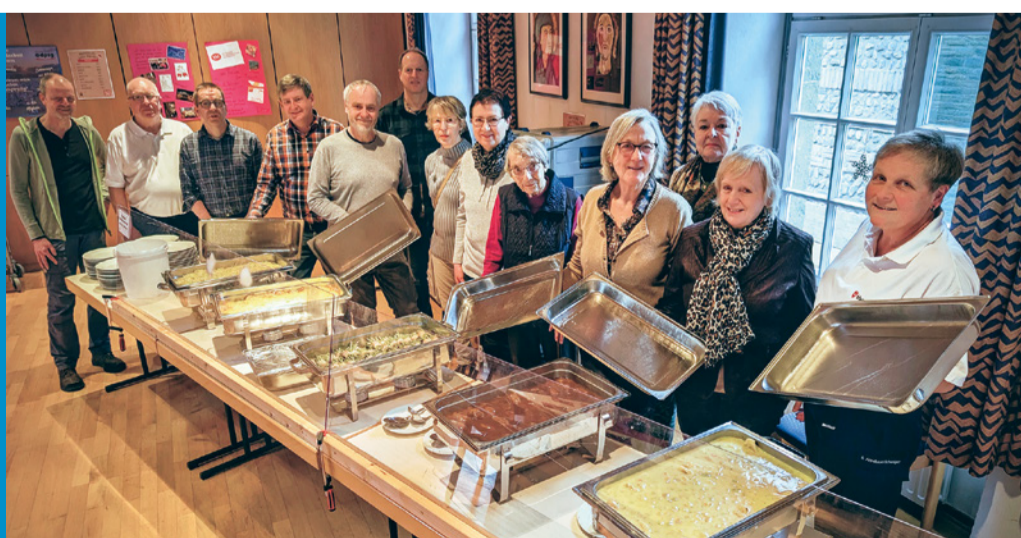
Mit dem Projekt „Da sein“ lädt die Pfarrei St. Patrokli in Soest Obdachlose zum Frühstück ein – oder auch zu einem Mittagessen, wie zuletzt in der Weihnachtszeit