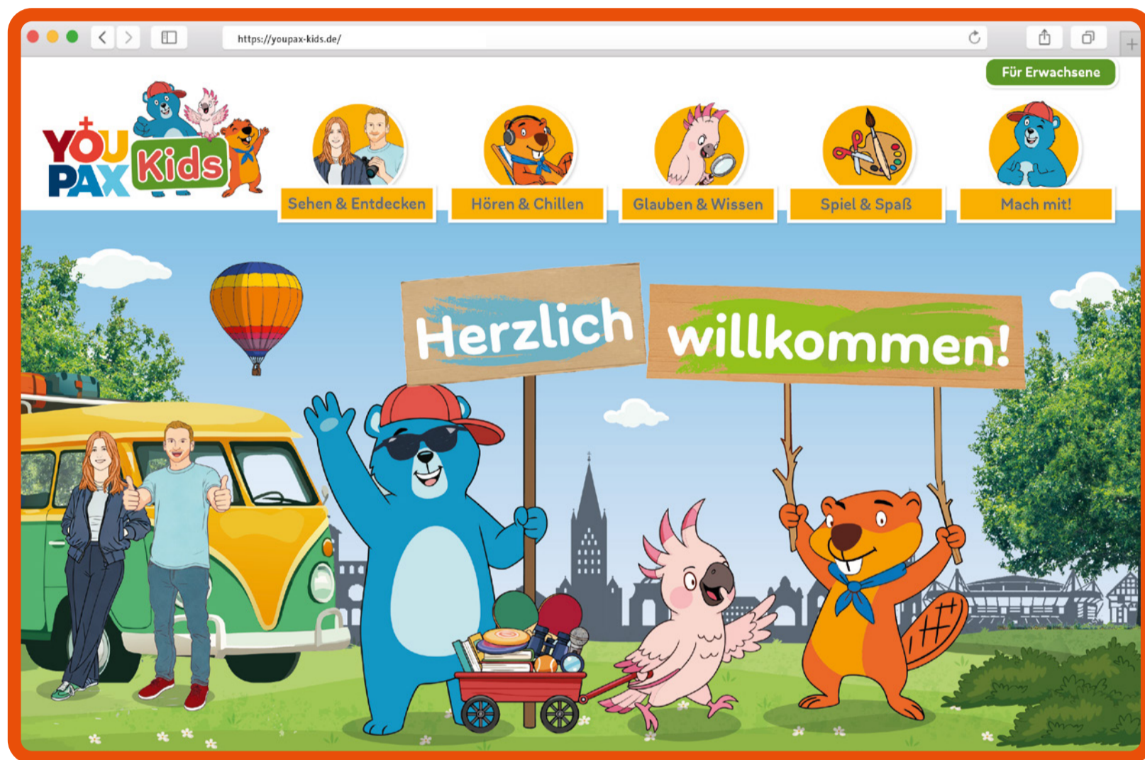
Das freche Trio Bärnhard Bär, Kiki Kakadu und Bodo Bieber begleitet Kinder mit Tipps und Infos auf YOUPAX Kids

ZUSAMMEN:HALT!-AKTIONSTAG • KINDERKIRCHE IN HERNE • WIE TICKT DIE JUGEND?!