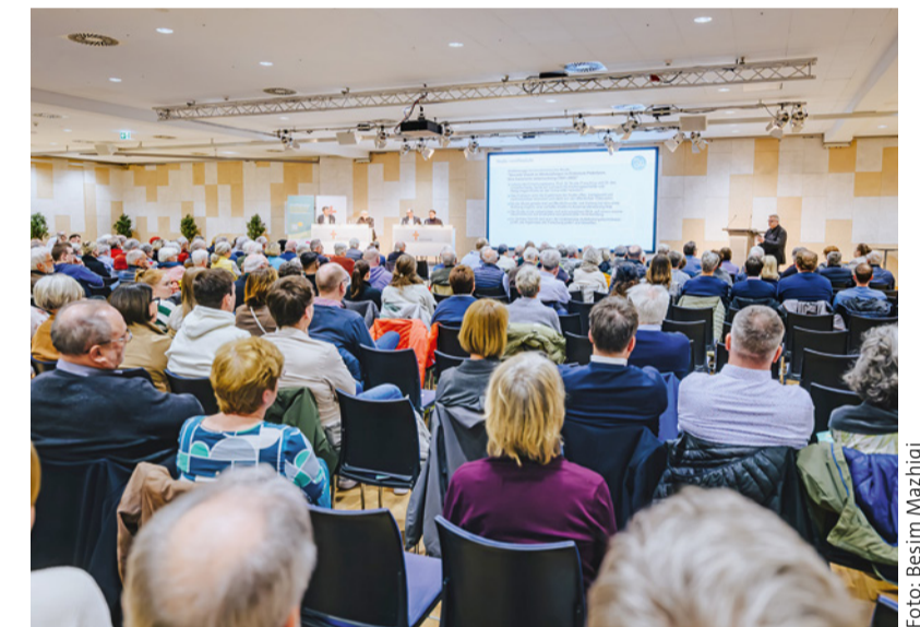
An den drei Dialogveranstaltungen nahmen rund 1.000 Menschen teil

haben, durch Wegsehen, Unterlassen und das bewusste Schützen der Beschuldigten. Sie zeigt auch, wie diese Bistumsleitungen Betroffene unter Druck setzten, die Vorwürfe nicht anzuzeigen, und so verhinderten, dass die Wahrheit ans Licht kommen konnte. Und sie zeigt, dass das weitere Umfeld die so entstehende Wagenburgmentalität verstärkte, indem Betroffene, die darüber sprechen