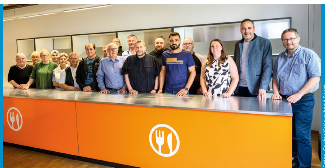
Die Tafel in Werl ist an sämtlichen Werktagen geöffnet. Aktuell versorgt sie insgesamt 635 Bedarfsgemeinschaften mit 968 Erwachsenen und fast 500 Kindern aus Werl und Umgebung